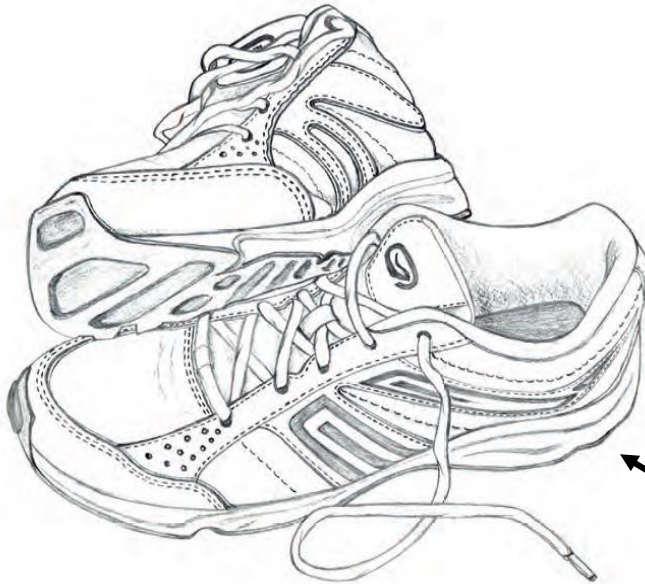
OBJETO TERMINADO TONOS DE LAPIZ.

4.- Dibujo: Ejercicio de Boceto de cualquier objeto cotidiano de la casa y terminarlo con tonos de lápiz y plumón negro las sombras.